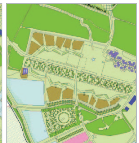
World Show Stage