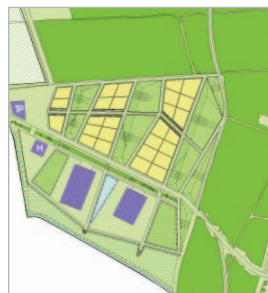
Education & Innovation