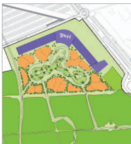
Relax & Heal

Enfin, l'horticulture constitue dans 'World Show Stage' (scène mondiale) la source d'inspiration pour l'art, la culture et les divertissements. La nature et la culture sont étroitement liées. L'art, la culture et les divertissements internationaux inspirent le secteur horticole et vice versa. World Show Stage est un lieu de rencontre de différentes cultures. Ici, le concept est intense et ludique. L'eau y joue également un rôle important. L'eau relie les différents continents et est la source commune de toute la vie. Un champ thématique haut en couleur offrant un spacieux cadre où se rencontrer effectivement.