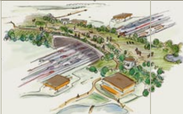
Meer ruimte voor planten- en diersoorten door ecoducten

Meervoudig ruimtegebruik binnen de bebouwde kom en ruimschoots meer 'ruilgroen' (toegankelijk, recreatief van karakter) op vrijkomend boerenland aan